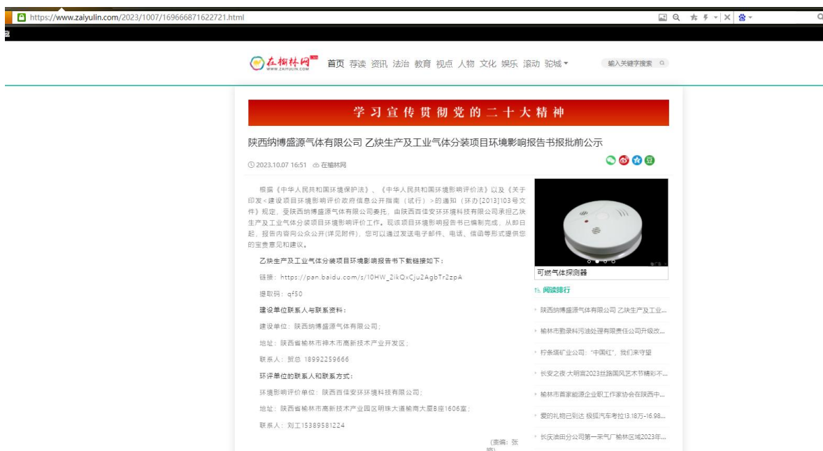
图 5.1 报批前公示截图