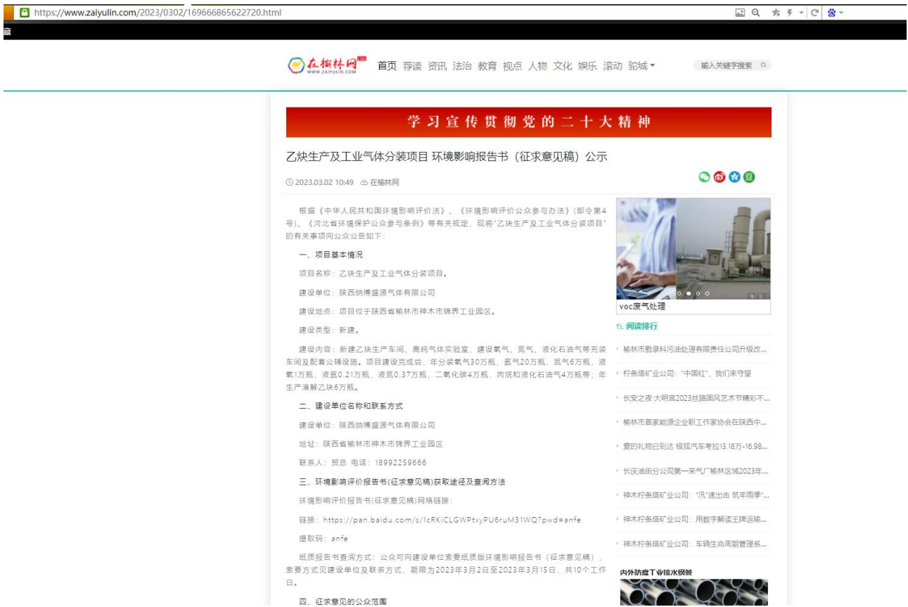
图3.1 征求意见稿环境影响评价信息公开截图