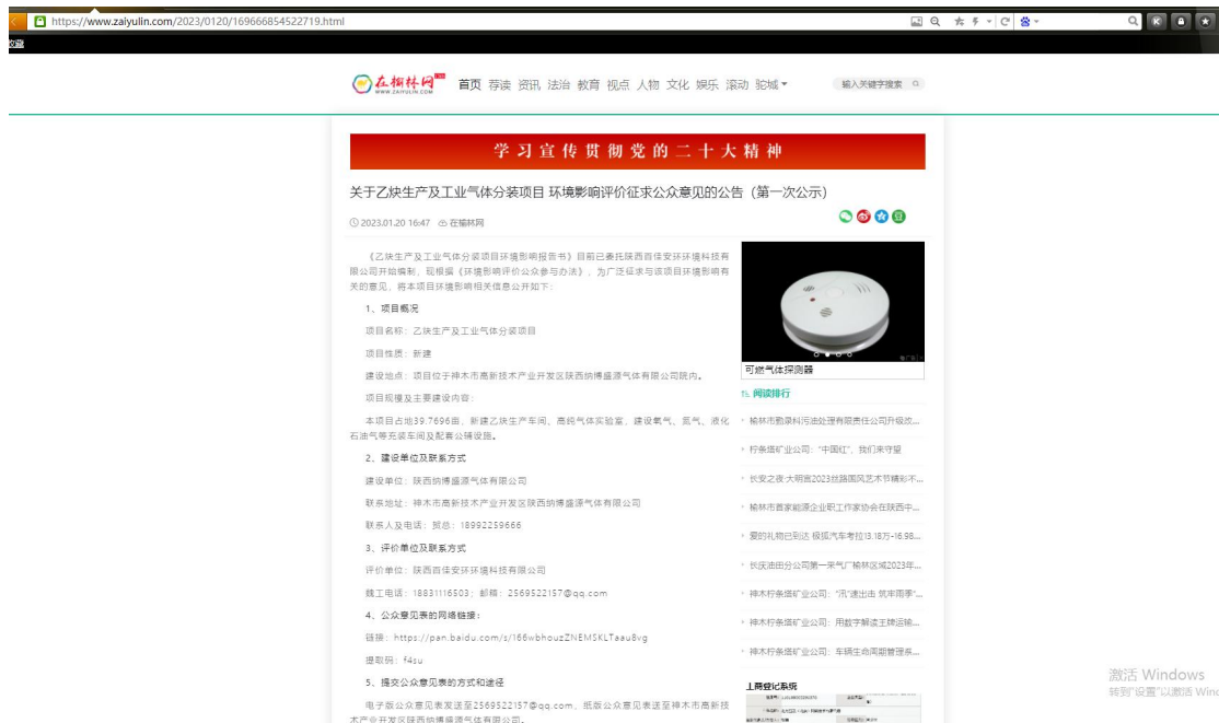
图2.1 首次环境影响评价信息公开截图

我公司于2022年11月10日委托陕西百佳安环环境科技有限公司承担了本项目的环境影响评价工作，于2023年1月12日在当地网站在榆林网站（公示网址： https://www.zaiyulin.com/2023/0120/169666854522719.html ）进行首次环境影响评价信息公开。公开主要内容见下图。