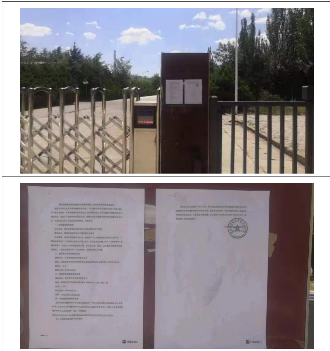
图 5 厂区门口