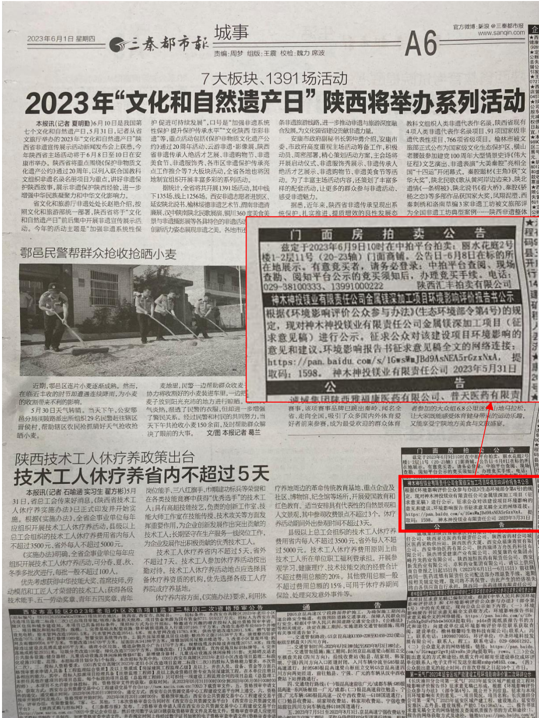
图3 征求意见稿报纸公示截图（2023年6月1日）

本环评的征求意见稿公开内容及公众意见表通过厂区所在地公开发行的“三秦都市报”进行公开，公开时间为2023年6月1日、2023年6月8日，共信息公开2次。报纸信息公开情况见图3、图4。