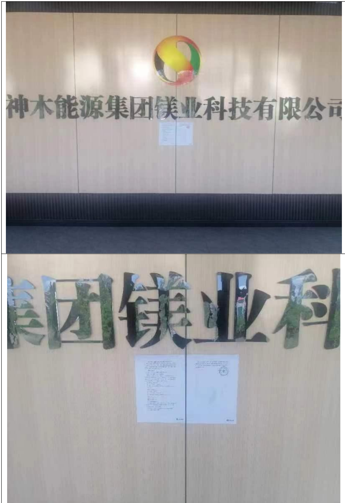
图 6 隔壁厂区照片