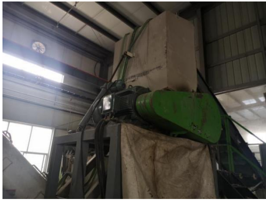
3#车间-湿法破碎工序