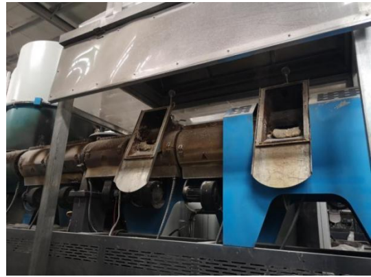
3#车间-熔融造粒工序