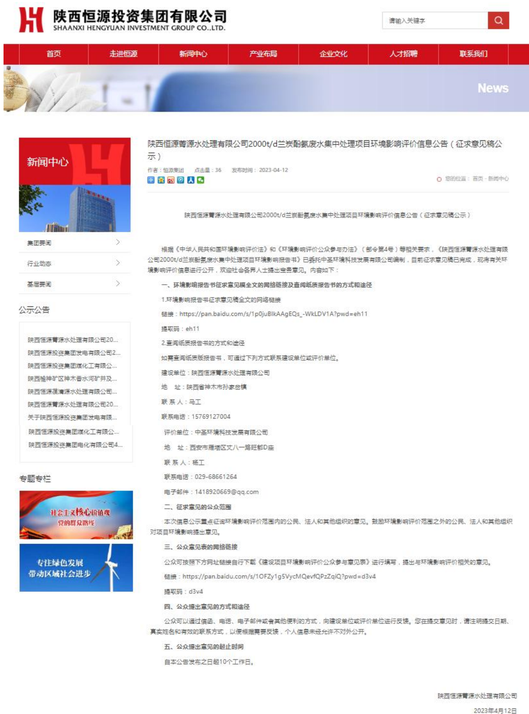
图二 征求意见稿公示网站截图