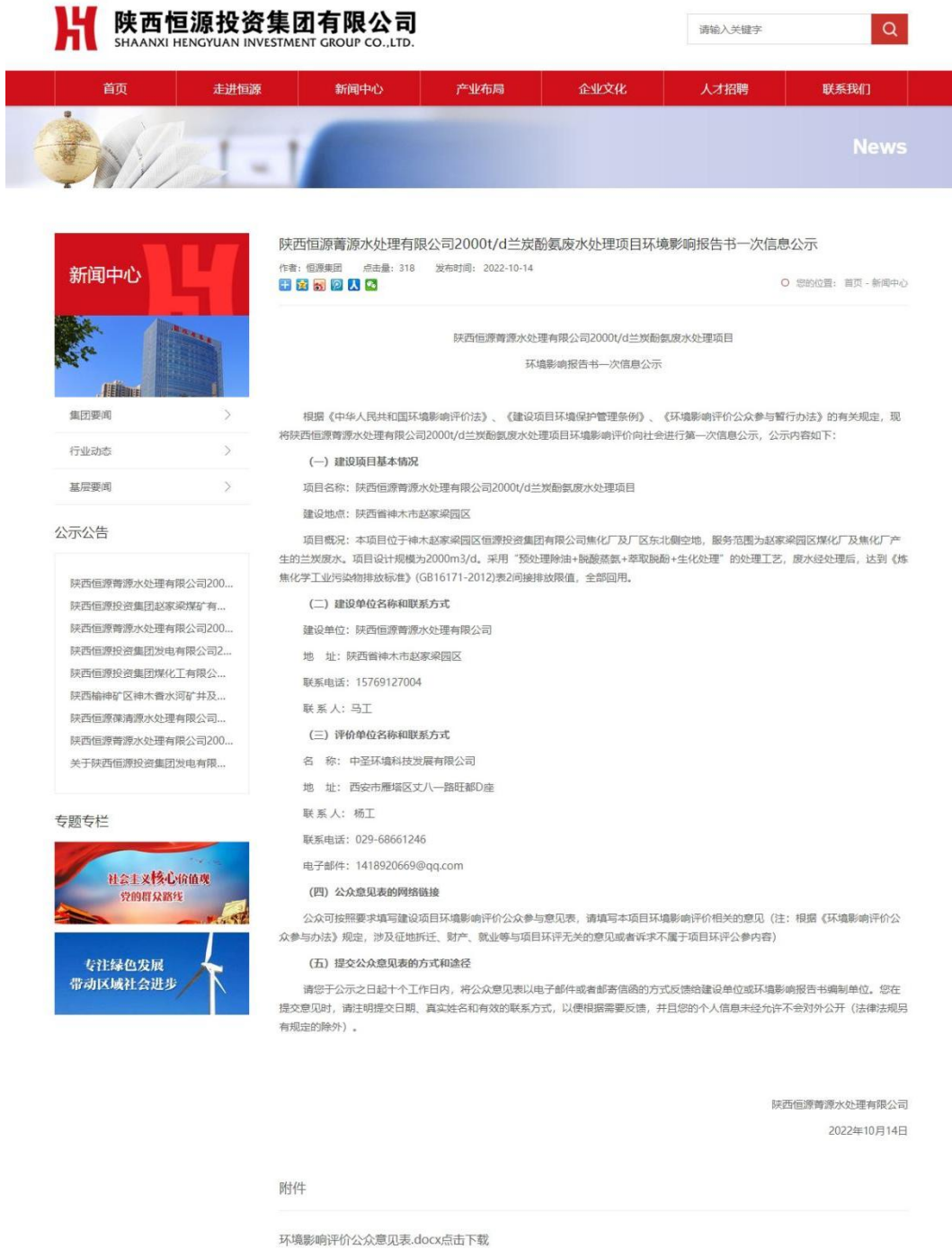
图一 首次环境影响评价信息网络平台公示截图